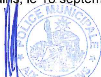
Le Maire d'Aix-les-Bains Renaud BERETTI